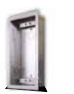
9135351D UP-Gehäuse für 1 Modul

125x235x46 mm Wandaussparung: 110x220x50 mm