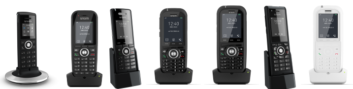
M25 M30 M65 M70 M80 M85 M90