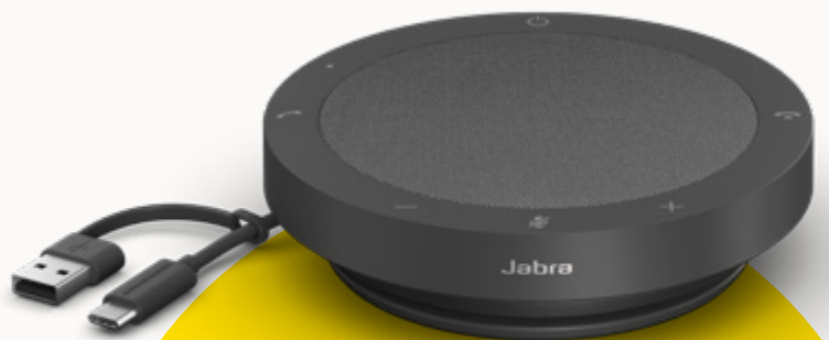
MS TEAMS- UND UC-VARIANTEN

Um unseren Planeten zu schützen, berücksichtigen wir den Aspekt der Nachhaltigkeit in jeder Phase der Produktentwicklung. Deshalb haben wir das Gehäuse der Speak2 40 aus über 50 % nachhaltigen Materialien** gefertigt und eine Reihe von Bauteilen integriert, die repariert oder ersetzt werden können. Mehr Nachhaltigkeit bedeutet eine längere Lebensdauer deiner Freisprechlösung – und sorgt für Gespräche in hoher Sprachqualität für dich und dein Team über Jahre hinweg.