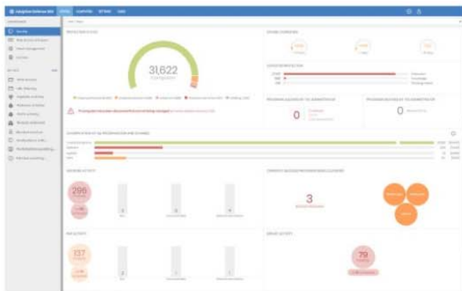
Abbildung 1: Zentrales Dashboard von Panda Adaptive Defense 360