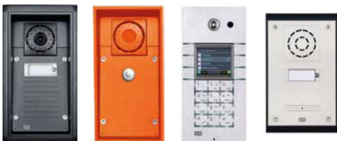
2N®EntryCom IP Force