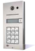
9137111CKD Basic, 1 Rufaste, Kamera und Tastatur 9137110CKD Pro, 1 Rufaste, Kamera und Tastatur