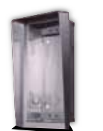
9135361D Wetterschutzrahmen und UP-Gehäuse für 1 Modul

225x235x46 mm Wandaussparung: 210x220x50 mm