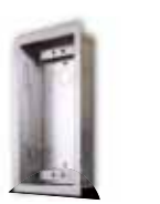
9135351D UP-Gehäuse für 1 Modul

125x235x46 mm Wandaussparung: 110x220x50 mm