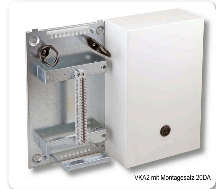
VKA2 mit Montagesatz 20DA