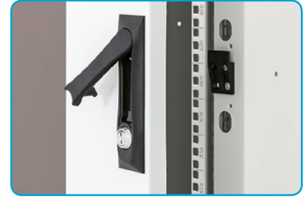
■ Triton-Schwenkhebelgriffe Durch den Austausch des Kunststoffmoduls (nicht im Beipack) kann zwischen einer klassischen und halbzyklischen Schließung gewählt werden. Patent: PUV 2013-27443