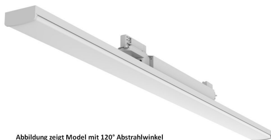
Abbildung zeigt Model mit 120° Abstrahlwinkel