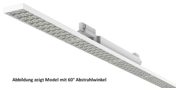
Abbildung zeigt Model mit 60° Abstrahlwinkel