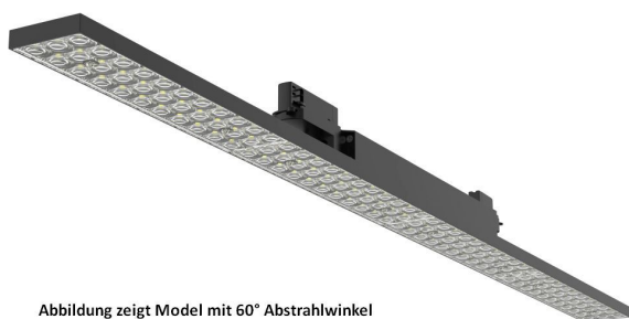
Abbildung zeigt Model mit 60° Abstrahlwinkel