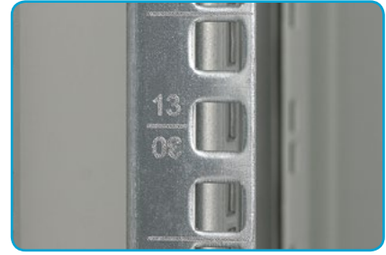
■ Laserbezeichnung der Vertikalen Stahlblech 2 mm