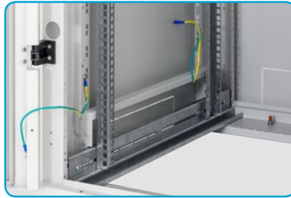
■ Erdung Alle abnehmbaren Teile sind gemäß der Anforderungen der entsprechenden Normen miteinander verbunden.