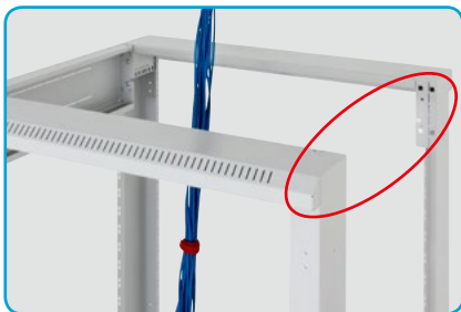
■ Kabelinstallation Einbau des Zubehörs, ohne dass die Kabel getrennt werden müssen.