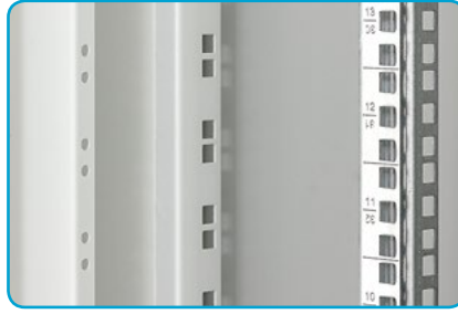
■ Perforierte Stützen Die Öffnungen über die gesamte Höhe der Stützen entsprechen den HE-Abständen der Vertikalen.