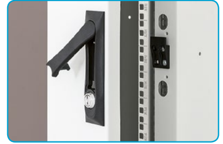
■ Triton-Schwenkhebelgriffe Durch den Austausch des Kunststoffmoduls (nicht im Beipack) kann zwischen einer klassischen und halbzyklischen Schließung gewählt werden. Patent: PUV 2013-27443