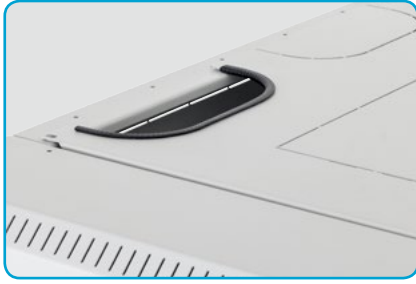
■ Einfassband 1 m im Beipack