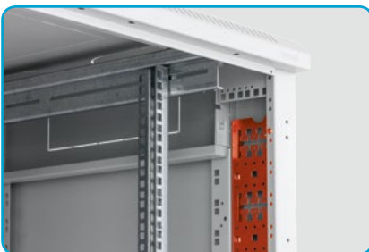
■ RAX-VP-Vxx-X2 Vertikale Kabelführungsstreben (optionales Zubehör)