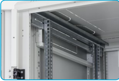
■ Befestigung der Vertikalen in 600 mm breiten Verteilern