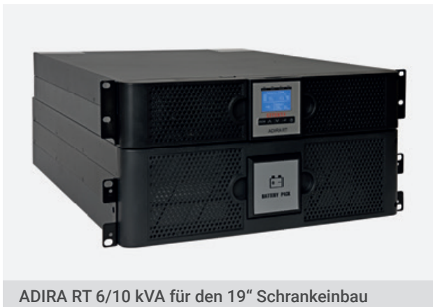
ADIRA RT 6/10 kVA für den 19" Schrankeinbau