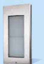
9135310D Infomodul ohne Tasten