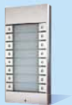
9135182D 16 Tasten Erweiterung