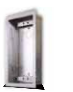
9135351D UP-Gehäuse für 1 Modul