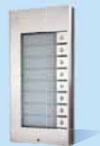
9135181D 8 Tasten Erweiterung