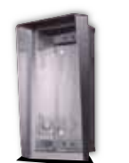
9135361D Wetterschutzrahmen und UP-Gehäuse für 1 Modul