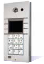
9137160CKDD Pro, 6 Rufasten, Tastatur, Kamera und Display