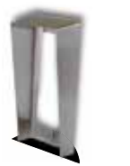
9135331D Wetterschutzrahmen für 1 Modul