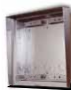
9135362D Wetterschutzrahmen und UP-Gehäuse für 2 Module