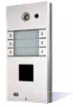
9137161CD Basic, 6 Rufasten und Kamera 9137160CD Pro, 6 Rufasten und Kamera