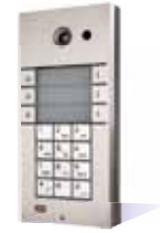
9137161CKD Basic, 6 Rufasten, Kamera und Tastatur 9137160CKD Pro, 6 Rufasten, Kamera und Tastatur