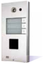
9137131CD Basic, 3 Rufasten und Kamera 9137130CD Pro, 3 Rufasten und Kamera