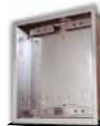
9135352D UP-Gehäuse für 2 Module