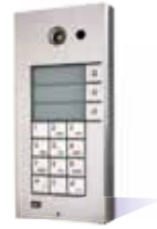
9137131CKD Basic, 3 Rufasten, Kamera und Tastatur 9137130CKD Pro, 3 Rufasten, Kamera und Tastatur