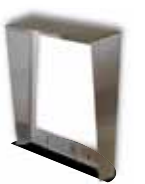
9135332D Wetterschutzrahmen für 2 Module