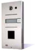
9137111CD Basic, 1 Rufaste und Kamera 9137110CD Pro, 1 Rufaste und Kamera