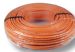
100 m Ring