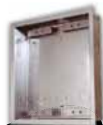
9135352D UP-Gehäuse für 2 Module