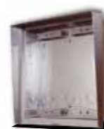
9135362D Wetterschutzrahmen und UP-Gehäuse für 2 Module