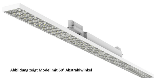
Abbildung zeigt Model mit 60° Abstrahlwinkel