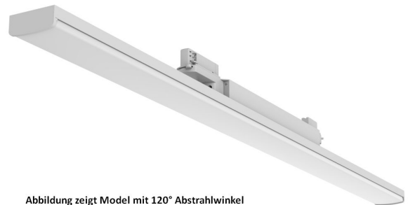
Abbildung zeigt Model mit 120° Abstrahlwinkel