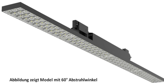
Abbildung zeigt Model mit 60° Abstrahlwinkel